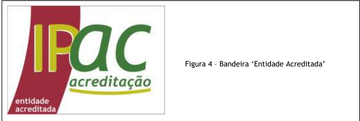
Figura 4 - Bandeira 'Entidade Acreditada'

A Bandeira 'Entidade Acreditada' pode ser colocada no exterior do edifício da entidade acreditada (em local de acesso ao mesmo) ou no interior, em salas de reuniões e salas de espera - pode igualmente ser usada em locais de exposição da entidade acreditada desde que sejam publicitadas atividades acreditadas.